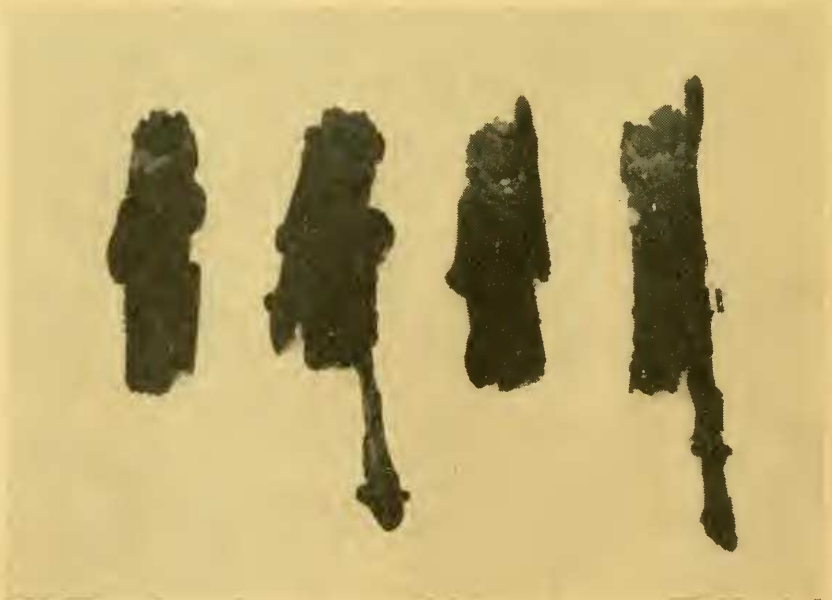
Abb. 2: Anordnungstypen maximal überragender Pflanzenteile am Köcher von Anabolia nervosa Curtis.